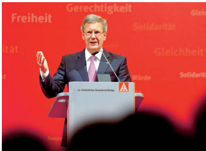
Neuer Verbündeter der IG Metall? Bundespräsident Christian Wulff lobte bei der Eröffnungsfeier die deutsche Mitbestimmung als eine der großen Stärken der Wirtschaft.