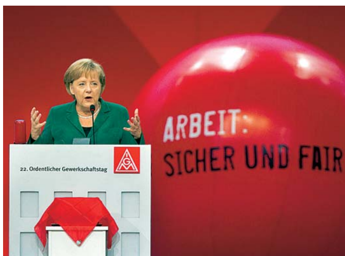
Metaller sind höfliche Menschen. Brav spendeten sie Angela Merkel Applaus, als sie zu den Delegierten sprach – vor allem über Europa. Nur als die Kanzlerin die Rente mit 67 verteidigte, gab es Buh-Rufe.

Mehr Fotos vom Gewerkschaftstag: ▶ www.flickr.com/photos/igmetall/