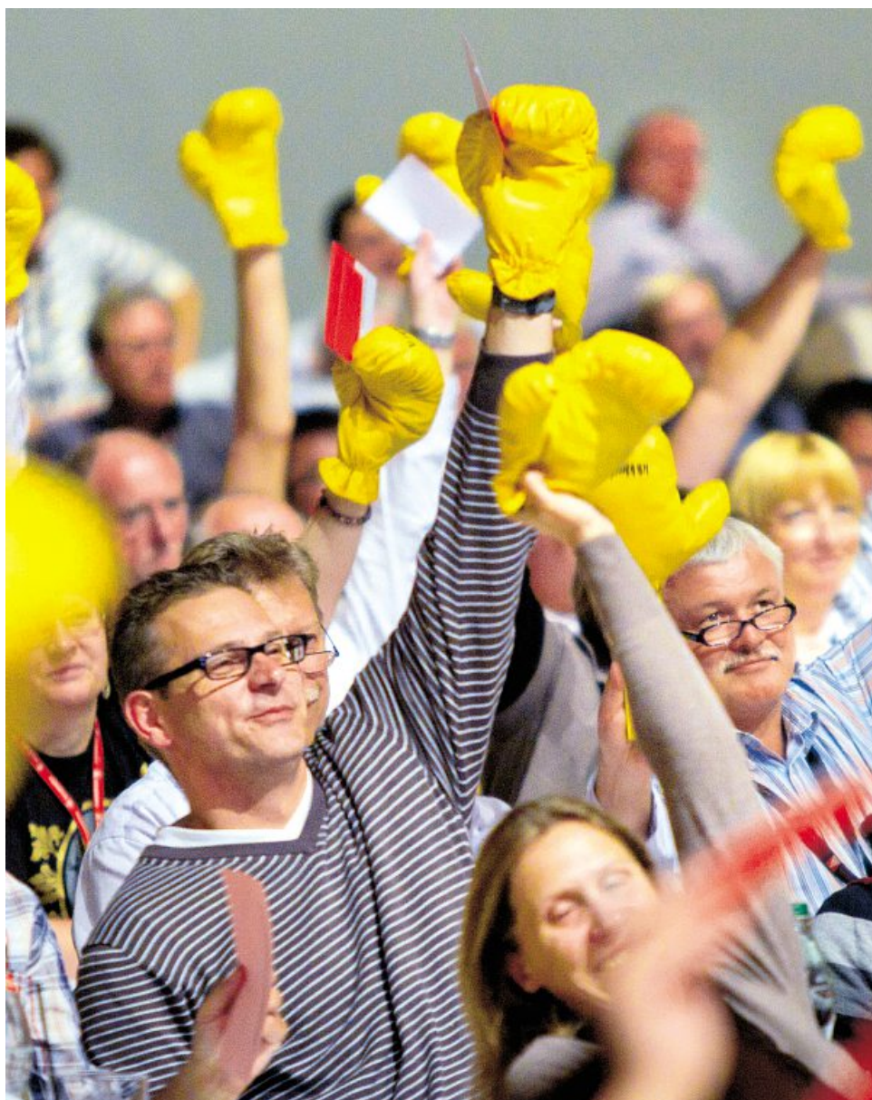
Bild oben: Die IG Metall boxt die unbefristete Übernahme der Auszubildenden durch – und steigt dafür in der kommenden Metall-Tarifrunde in den Ring. Dafür stimmten die Delegierten einstimmig. Die Boxhandschuhe hatte die IG Metall-Jugend bereits bei ihrem Aktionstag am 1. Oktober ausgepackt (siehe Seite 4).

: Dein Vorteil Du, Deine Kinder und Enkelkinder sollen eine gute Ausbildung und eine sichere Zukunft haben. Weitere Sorgen und Wünsche? Die IG Metall will Eure Themen aufgreifen, gemeinsam mit Euch Lösungen erarbeiten und umsetzen.