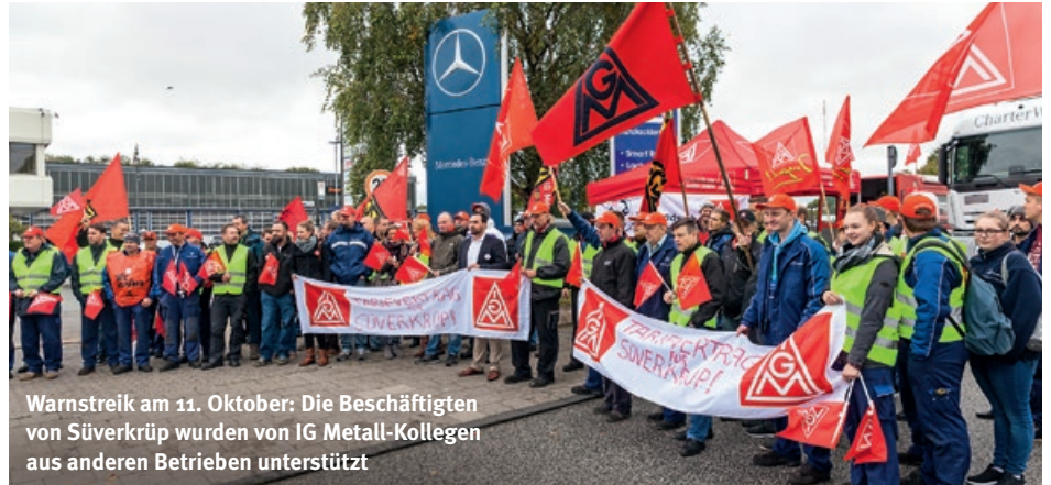
Warnstreik am 11. Oktober: Die Beschäftigten von Süverkrüp wurden von IG Metall-Kollegen aus anderen Betrieben unterstützt

Mit einem Warnstreik und einem Autokorso durch Kiel zeigten die Beschäftigten der Süverkrüp Automobile GmbH & Co. KG Mitte Oktober, dass sie sich nicht länger von ihrem Arbeitgeber beim Thema Tarifbindung hinhalten lassen.