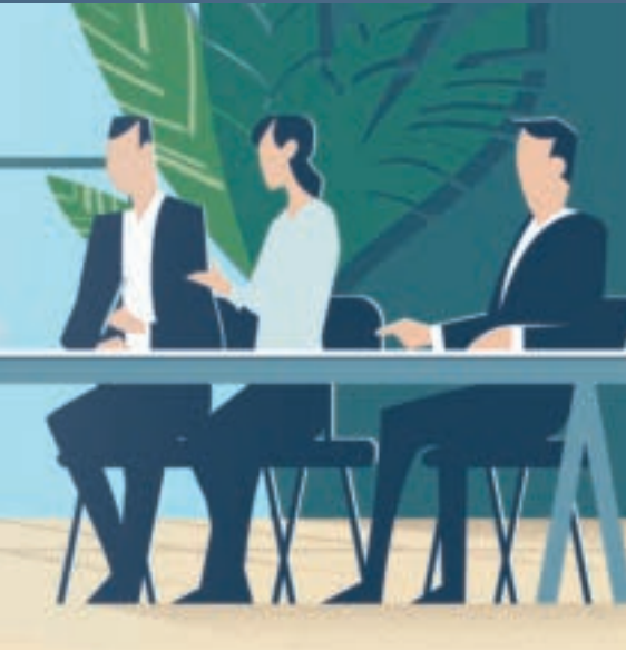
Illustration: Gregor Josten